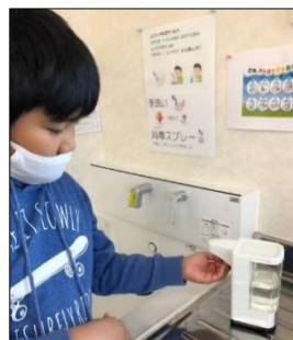
<ハンドスプレー オートディスペンサー>