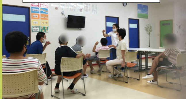
防災啓発 DVD 鑑賞