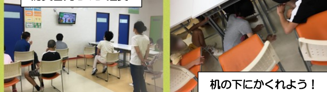
机の下にかくれよう!