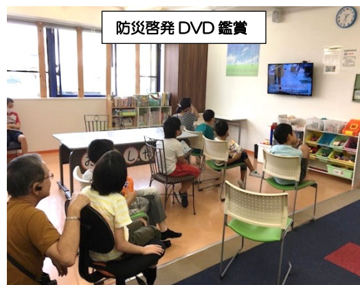
防災啓発 DVD 鑑賞