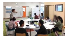
対話をして決めています。