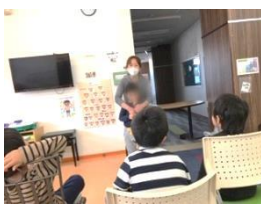
終わりの会 今日の楽しかった事を 聞かせてください。