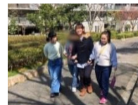
お買い物学習の帰り道