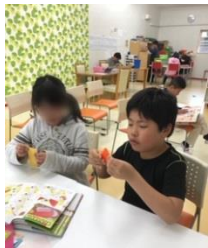
折り紙 こうやって折るんだよ