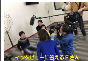
インタビューに答えるFさん