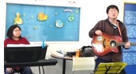
はるばる沖縄から来て下さいました!