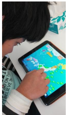
今日は、タブレットにしようかな？パソコンにしようかな？