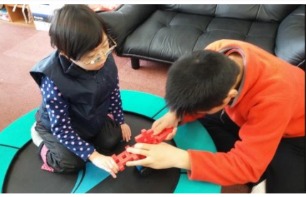
年齢差があるお友だちは、兄妹みたいで微笑ましいです。