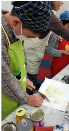
<クッキング> 玉ねぎを上手に刻んでいます。 でも、目が… イタ～イ！