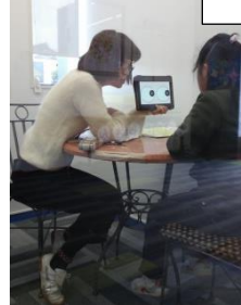
<ビジョントレーニング> ←タブレットで、目が動いているかどうかチェックしています。