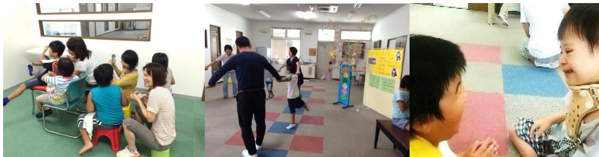
みんなでドライブ！

ユニバーサルスクールの理念である すきなこと見つけ・お友だちづくり の居場所になってきていることがスタッフ一同の喜びです。