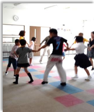
みんなで踊ると、たのしいネ

● 三田を中心に誰もが参加できる 年一回 開催の ダンスイベント に参加しま〜す!