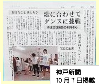
神戸新聞 10月7日掲載

子どもたちは、曲が流れだすと元気いっぱい！ 笑顔いっぱい！ すっごく楽しみましたネ～！ 最初から会場には、温かい手拍子が！ 踊る側も、観る側も 一つになって感動の渦！ 学校の先生や保護者の方も 応援に駆けつけてくださいました。 来年は、もっとたくさんの「かがやきっ子」たちで いっしょに楽しみましょう！